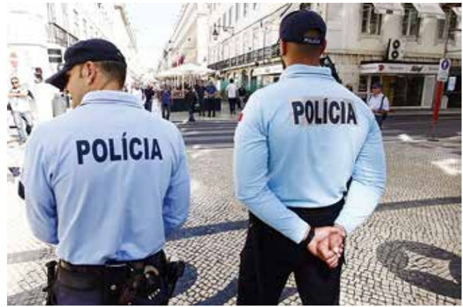
Sterk gelijkende uniformen van GNR (links) en PSP (rechts)

niet benutten, aldus de commandant. Vervolgens leidde de kolonel ons rond over het terrein en de gebouwen van zijn bureau. De traditie wil dat bij de twee pelotons beredenen van het district Porto nog aantal rijden op schimmels.