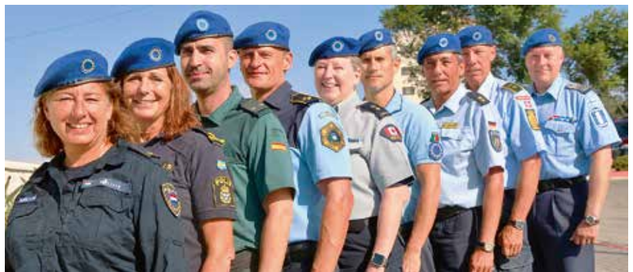
Nederlands, Zweeds, Spaans, Sloveens, Canadees, Portugees, Duits, Deens en Fins. De nationaliteiten van de afdeling Police Advisory Section op een rijtje.

Vrouwelijke politiemedewerkers verdwijnen vaak ook op kantoorfuncties en, in tegenstelling tot bijvoorbeeld in Jeruzalem, zie je ze vrijwel niet op straat. Ze maken ook geen onderdeel uit van de Special Police Forces. De missie probeert gender mainstreaming enorm te stimuleren maar ook hiervoor geldt: dit is zo enorm cultuurgebonden dat verandering een lange adem vergt. Overigens zijn er wel een Gender Unit in alle districten en twee vrouwelijke Community Policing District