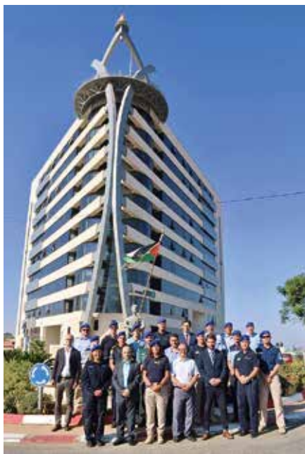
Met de Police Advisory Section voor het kantoor in Ramallah. Ik sta links voor.

Mochten collega's interesse hebben in een missie, kijk dan regelmatig op de pagina Internationaal op intranet. Als er weer mensen nodig zijn, wordt dat op deze pagina's aangegeven. De enige tip die ik voor nu kan meegeven: als je interesse hebt, heb geduld en zet door! Ik heb tot nu toe geen spijt van mijn beslissing. Het bevalt mij hier goed. Het werk gaat trager dan ik gewend ben en ik kan niet alles aanpakken op de wijze waarop ik dat in Nederland doe, maar je stelt je daar op in en je leert er ook van. Ik weet dat ik de situatie hier niet ga veranderen. Hopelijk kan ik een heel klein beetje bijdragen aan de opbouw van de Palestijnse politie. Al is het maar een heel kleine voetprint die ik hier kan achterlaten, dan is mijn missie in elk geval geslaagd.