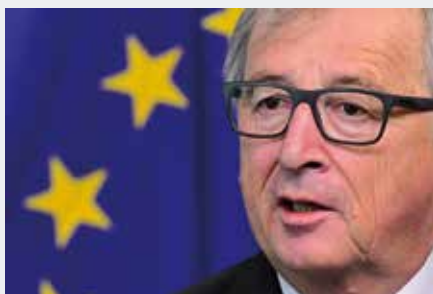
Eurocop sprak met Juncker

naast haar hoofdkantoor in Luxemburg, voor haar lobbyactiviteiten een steunpunt in Brussel. Daarmee is uitvoering gegeven aan een van de wensen van het Congres van Eurocop in Dublin van 2015.