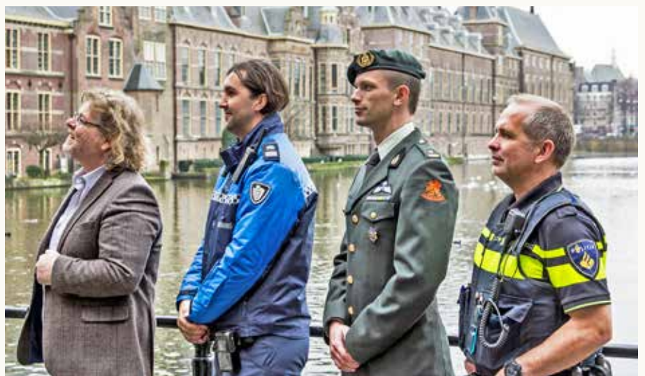
De Coalitie voor Veiligheid staat sterk met dé vier veiligheidsdisciplines.

De nieuwe dreigingen doen zich voor op zowel internationaal als nationaal niveau. Daarom kan alleen een integrale aanpak van alle veiligheidsdiensten vanaf de bron, onderweg, aan de Europese buitengrenzen, de Nederlandse binnengrenzen en in onze wijken hier een oplossing brengen. Wij denken dat het hard nodig is om politiek Den Haag, maar ook onszelf een aantal vragen te stellen. In hoeverre kunnen veiligheidsorganisaties elkaar aanvullen, helpen en ondersteunen? Hoe kunnen wij proactiever worden? Waar zijn technologische innovaties en investeringen voor