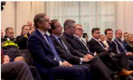
De Investeringsagenda in handen van lijsttrekkers in Den Haag op 31 januari.

onze veiligheid nodig? Hoe kan de informatievoorziening geoptimaliseerd worden?