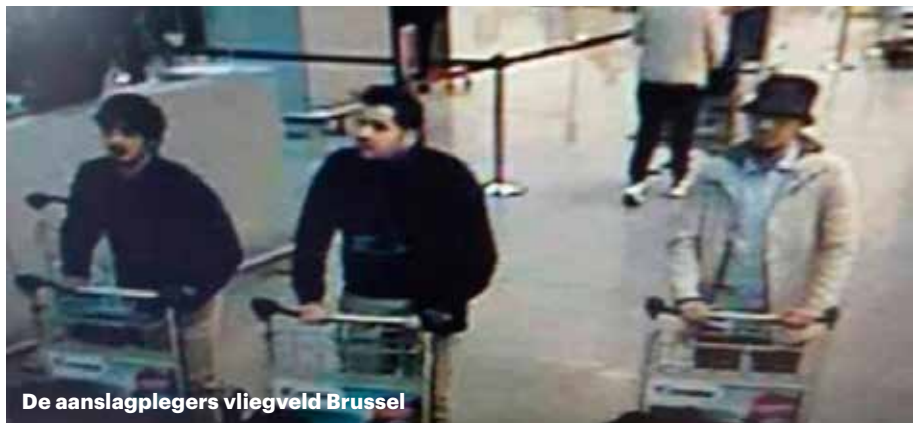
De aanslagplegers vliegveld Brussel

Voor de deelnemers aan de conferentie was de inleiding van de Belgische collega, hoofd van de politiebewaking op vliegveld Zaventem, het meest indrukwekkend. Uit eerste hand werd vernomen hoe de situatie was op het vliegveld direct na de aanslag. Veel meer nog, wat dit met jou doet als hoogst aanwezige leidinggevende in de eerste uren ('gouden uur') na de aanslag. Chaos, paniek, kermende mensen, gilende mensen, mensen die je aanklampen, loeiende sirenes, die niet uit kunnen, geen verbindingen meer, bloed, gewonde mensen, dode mensen, paniek onder de hulpverleners, paniek onder je medewerkers... Je eigen onzekerheid en toch de leiding weten te geven. Het werd stil in de zaal.