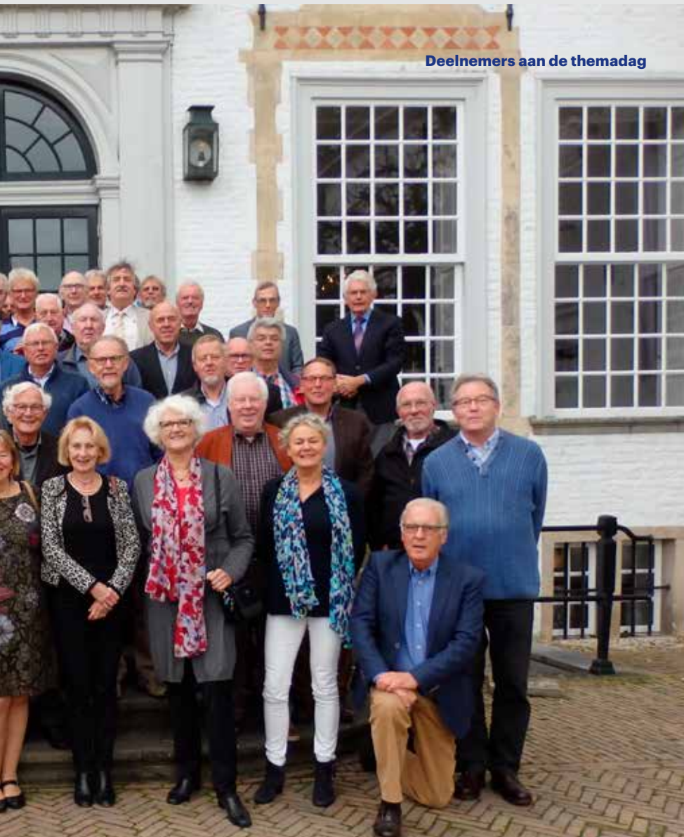
Deelnemers aan de themadag