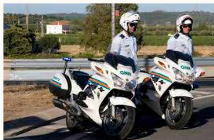
Inzet van een motoreenheid van het motoreskadron van de GNR